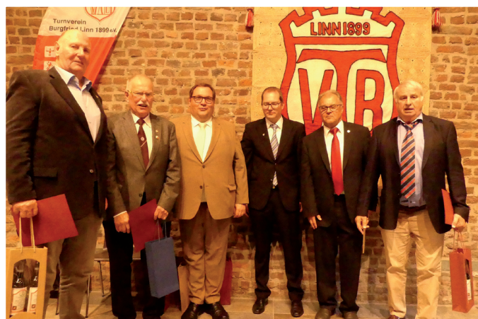
Über 65 Jahre im TVB