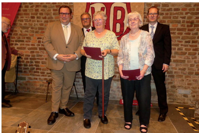
40 Jahre im TVB