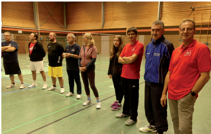
Indiacaspieler und Badmintonbetreuer