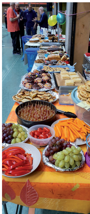
Was für ein Buffet!