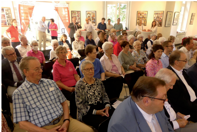
125 Jahre TVB im Greiffenhorst Schlösschen