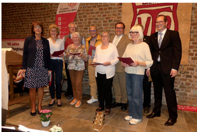
25 Jahre im TVB