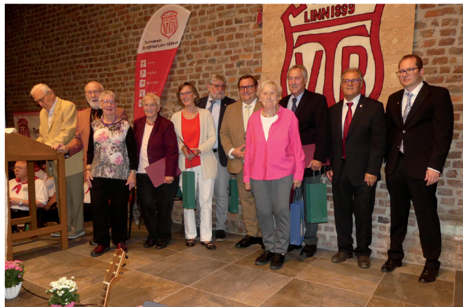
60 Jahre im TVB