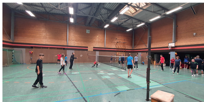
Auch Badminton konnte ausprobiert werden