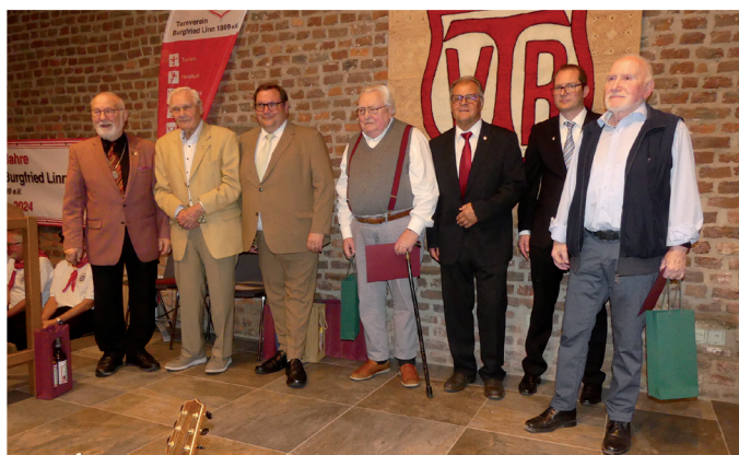
70 Jahre und mehr im TVB