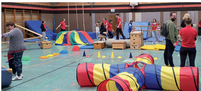
Spielparadies für die Kleinsten