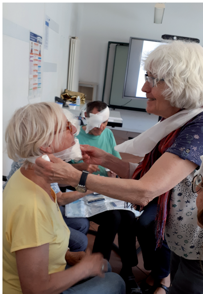
Alles wird schön verbunden

gemeinsam zu begutachten bzw. begutachten zu lassen. Wie zu Anfang schon erwähnt: Ein für alle wichtiger Programmpunkt war auch der Defibrillator, dessen Funktionsweise erklärt wurde und dessen sprachliche Hinweise wir dann zu hören bekamen. Die anstrengendste Übung folgte anschließend mit der Durchführung der Herz-Lungenmassage. Auch hier zeigte sich wieder, wie vorteilhaft es war, diese nicht nur erklärt und gezeigt zu bekommen, sondern auch selbst durchzuführen. 2 Filme über die Arbeit der Feuerwehr mit dem Defibrillator bzw. die Wiederbelebung (nicht gestellt) sorgten für weitere Abwechslung. Zum Schluss wurde uns noch gezeigt, wie man bei einem Verkehrsunfall den Helm eines Motorradfahrers abzieht. Leider reichte die Zeit nicht aus, um dies auch selbst ausprobieren zu können. Eindringlich wurden wir noch darauf hingewiesen, wie wichtig es ist zu helfen: Nur wer nicht hilft, macht etwas falsch! Mit gestärktem Selbstvertrauen verließen wir den Kurs, aber auch in dem Bewusstsein, dass nach einiger Zeit doch wieder einiges Wissen verloren gegangen sein würde. Deshalb kam die Idee auf, die Übungsleiter/innen