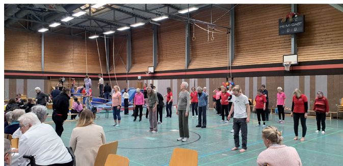
Yoga mit Nike