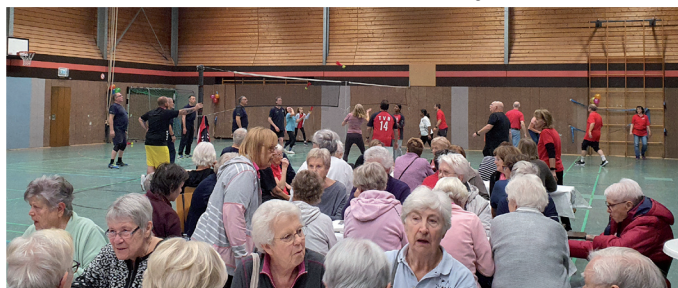
Im Hintergrund Indiacas - Vorführung und Mitmachen