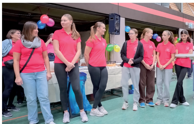
Ü-Leiter Turnen mit 4 Helferinnen