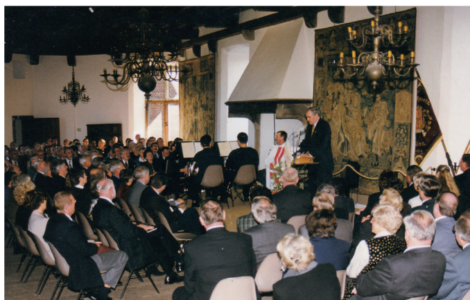
Festversammlung (1989) des TVB im oberen Rittersaal der Burg Linn