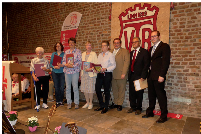
50 Jahre im TVB - neue Ehrenmitglieder