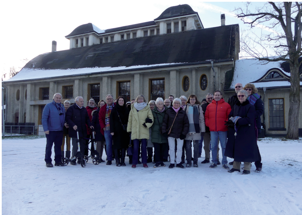
Besuch des alten Klärwerkes von 1906 am Uerdinger Rundweg