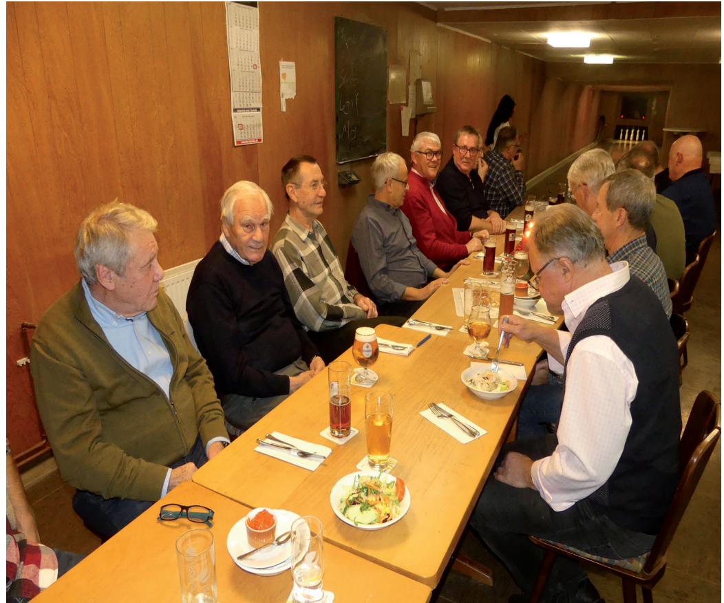
Adventskegeln der Indiacca-Gruppe