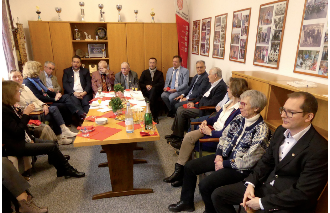
Neujahrsempfang im Geschäftszimmer