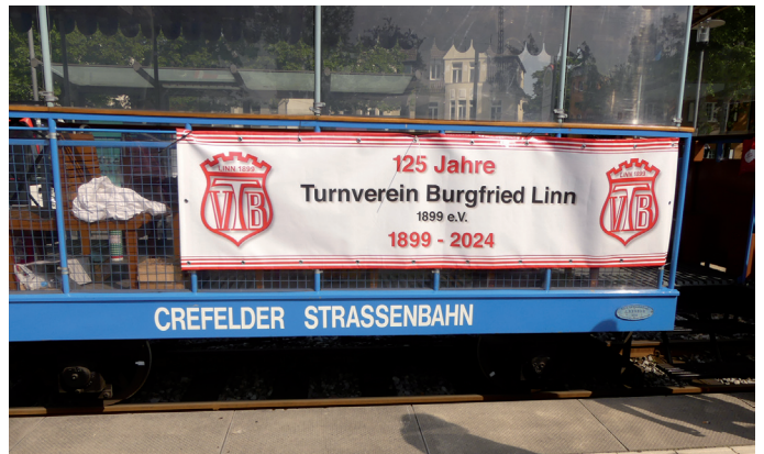
Ein Waggon mit dem TVB-Banner geschmückt