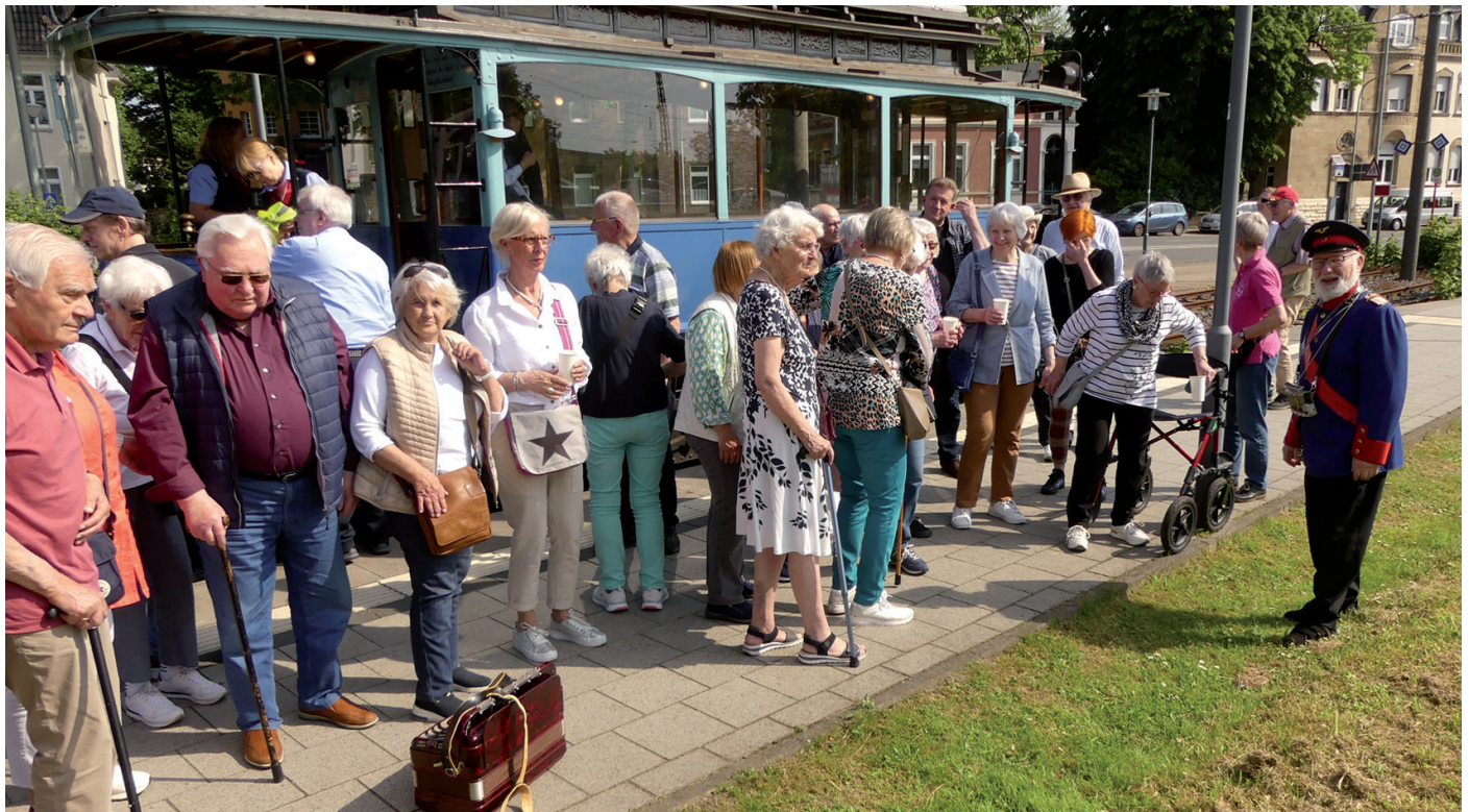
Alle einsteigen, bitte!