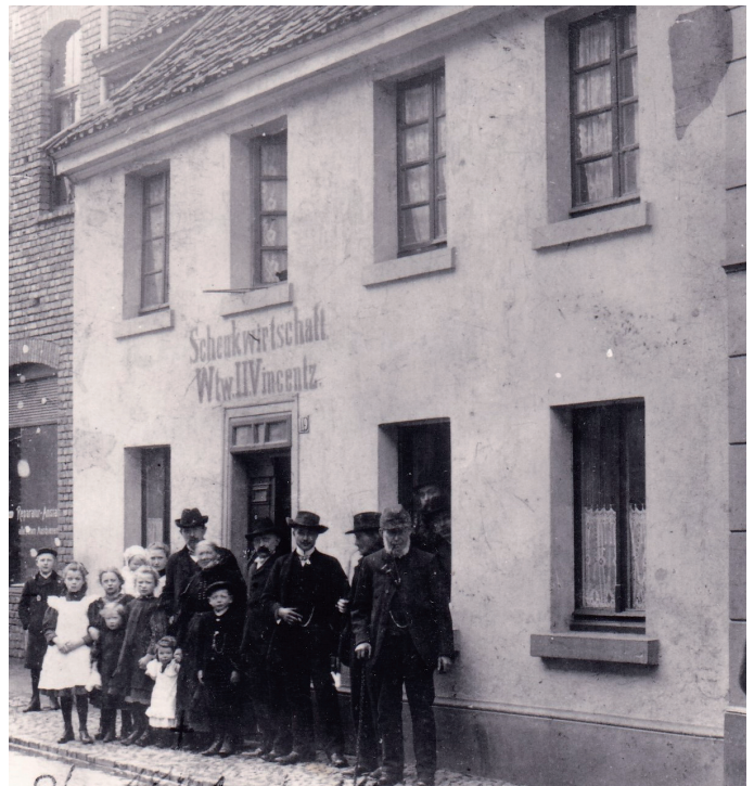
Gründungslokal „Schenkstwirtschaft Vincentz“