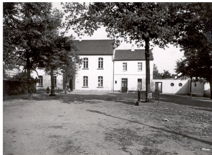
Baumpflanzung auf dem Margaretenplatz vor unserem Geschäftszimmer