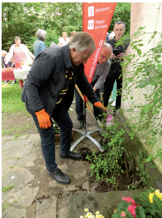
2 Rosenstöcke wurden gepflanzt