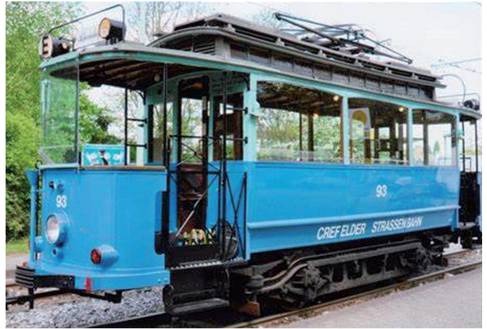
Die historische Straßenbahn "Blauer Enzian"