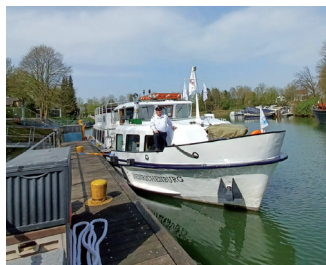
Das Schiff „Henrichenburg“

de mit dem Bauwerk in den 1990er Jahren in ein Museum umgewandelt und konnte so erhalten werden. Zwei Museumsführer haben uns die Arbeitsweise bei einem Rundgang vom „Unterwasser“ zum „Oberwasser“ anschaulich erläutert. Wenn man sich diese Ideen und