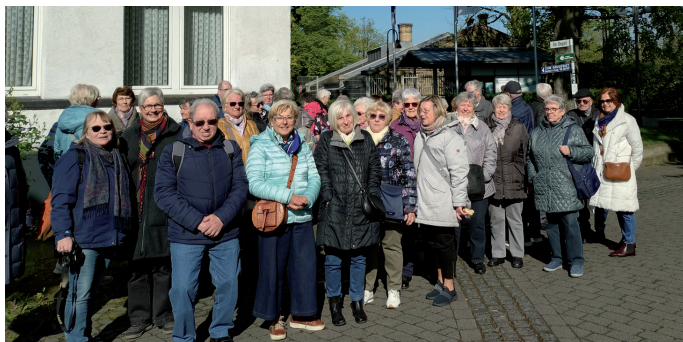
Die Ü60er am Schiffshebewerk-Henrichenburg-Waltrop