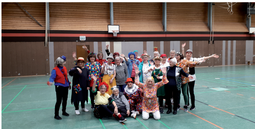
So feiern die Frauen des TVB

Am Mittwochabend vor Karneval fand unsere Bewegungsgymnastik im Kostüm statt. Bei einigen Teilnehmerinnen musste man erst einmal raten, wer sich unter der Perücke versteckt hatte! Unsere Übungsleiterin Anna bewegte uns zu fetziger Karnevalsmusik durch die Halle, im Kreis oder als Polonaise einzeln oder zu zweit oder viert – die Halle bietet viel Raum! Als wir endlich eine Pause verdient hatten, setzten wir uns und genossen die kleinen Köstlichkeiten und das umfangreiche Programm, das aus den eigenen Reihen gestaltet wurde: Ein gelenkiges Funkenmariechen bot einen lustigen Bericht sowie eine toll getanzte Solonummer. Eine „Anti-Karnevalistin“ und eine Frau, die nichts anzuziehen hat, erzählten von ihren Sorgen. Passend zur neu eröffneten Mac Donald's-Filiale schilderte eine Kundin die Verständigungsprobleme beim Bestellen einer Mahlzeit (Chicken? Nein, das esse ich hier!) Eine etwas naive Frau erzählte von ihrer Wallfahrt nach Kevelaer, die mit neuen Bekanntschaften