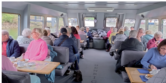
Alle an Bord der „Henrichenburg“