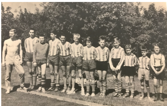
Jugendmannschaft des TVB im Jahre 1965-66