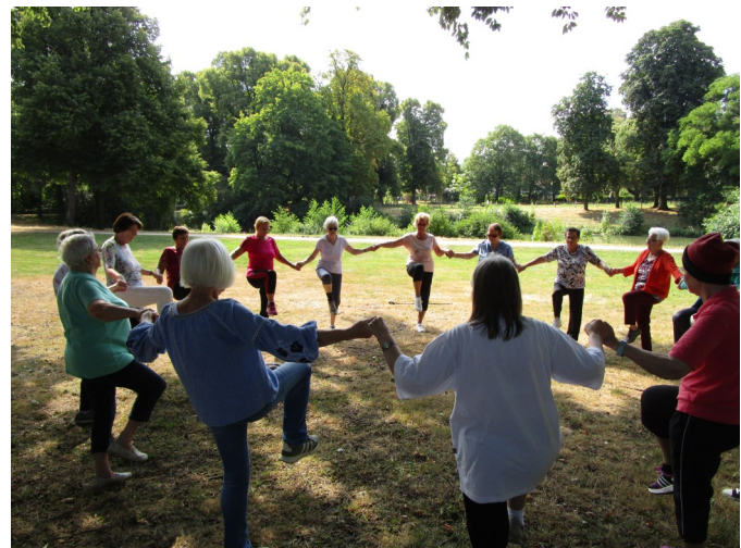
Turnerfrauen im Greiffenhorstpark

Donnerstag turnten gut 20 Frauen dort zur Freude der vorbeikommenden Spaziergänger, sonst wegen der Hitze ein paar weniger. Wir Frauen danken für das tolle Angebot. Wir haben die Bewegung in der frischen Luft sehr