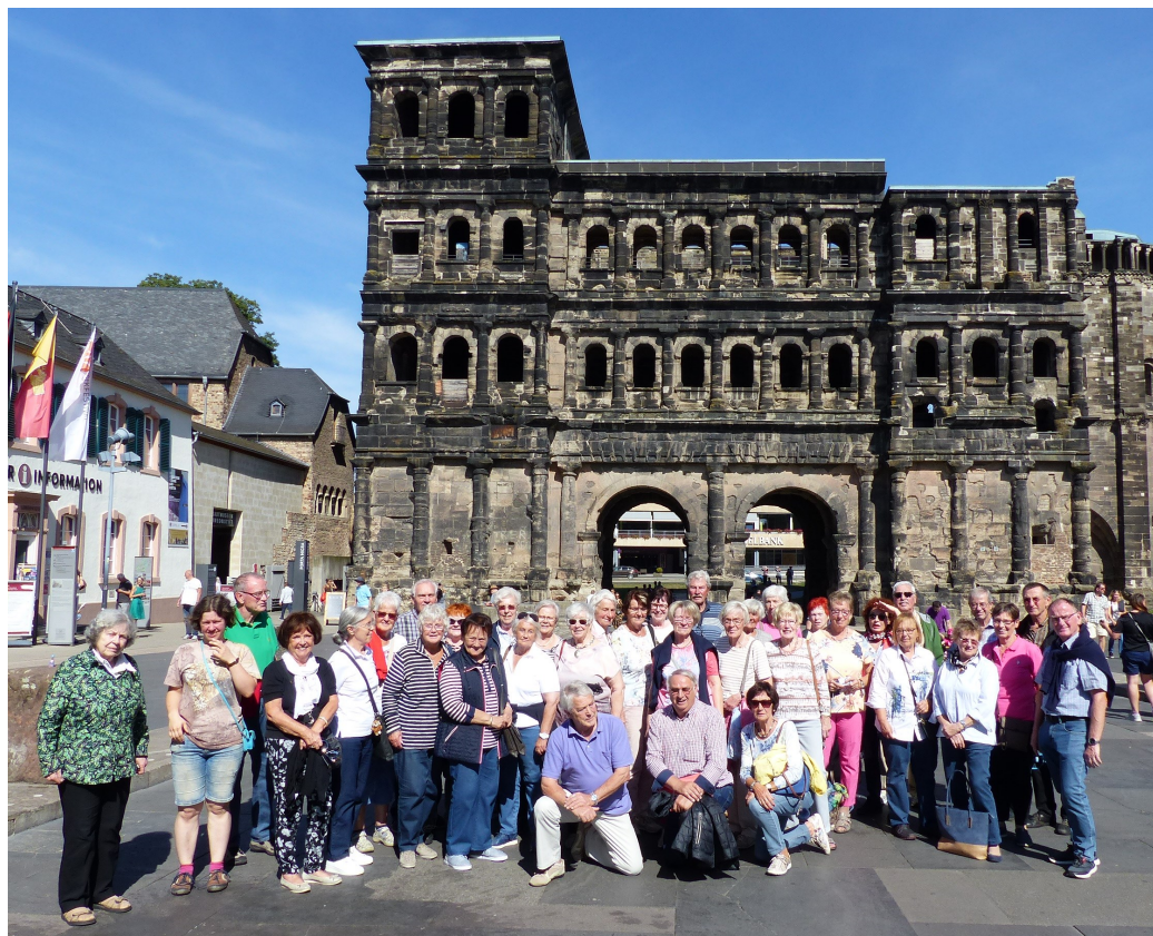
Reisegruppe in Trier vor der Porta Nigra

Zum Abschluss der Reise erfolgte eine Stadtführung durch die Landeshauptstadt Saarbrücken. Das