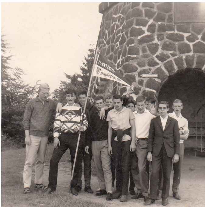
Die Handballjugend 1960