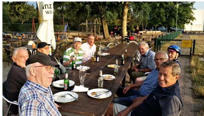
Eine Rast am Egelsberg