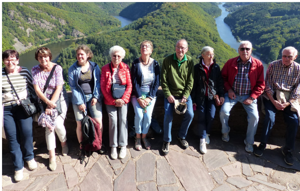
Ein Teil der Reisegruppe vor der Saarschleife