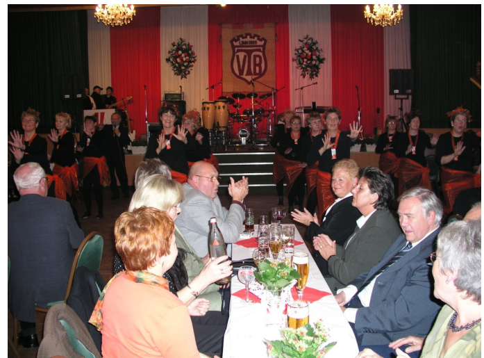
Herbstfest mit ausverkauftem Saal