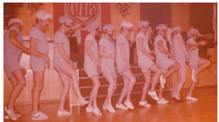
Darbietung der Männertruppe