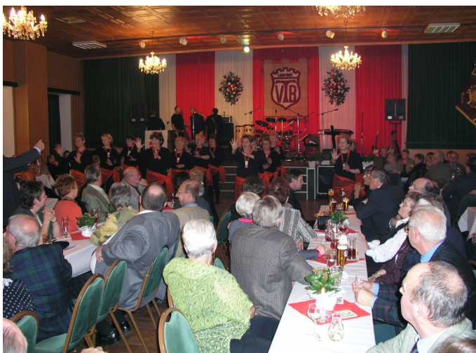
Herbstfest mit ausverkauftem Saal

schnitt der Turn- und Gymnastikabteilungen darzustellen. Es war auch ein Fest der Generationen, die sich hier meist im ausverkauften Saal wiedersahen und vergnügten. Nachdem der Saal an der Rheinbabenstraße veräußert und abgerissen wurde, findet leider keine für die Gemeinschaft so fördernde Veranstaltung mehr statt. Vielleicht finden sich im TVB Vereinsmitglieder, die eine Neuauflage des ehemaligen Herbstfestes organisieren. Möglichkeiten in Linn bezüglich Räumlichkeiten sind vorhanden, allerdings in einem kleineren Rahmen.