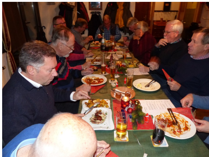
Essen fast fertig