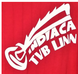
Linner Indiacat Logo

Hausdülmen verloren. Sie zog ins Spiel um Platz 3 ein und hat dieses Spiel gewonnen! Die Spieler, die nicht