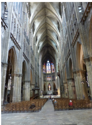
Kathedrale in Metz

Der nächste Tag war historisch geprägt, indem unter anderem das Schlachtfeld des Ersten Weltkrieges in Verdun / Frankreich mit