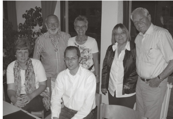
Ein paar vom Vorstand