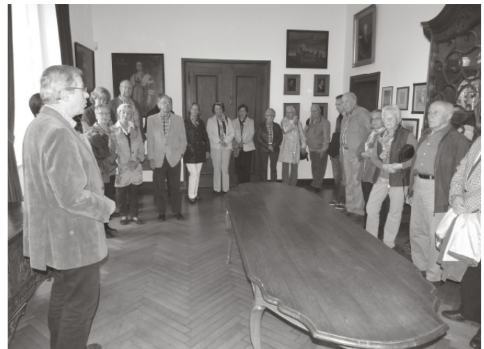
Gesamtvorstand mit dem Ältestenrat besichtigte das Jagdschloss auf Burg Linn.