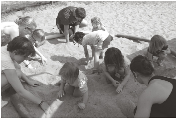
Eine Schatzsuche kommt immer gut an und macht viel Spaß

( Anna Weiße ) Am letzten Montag vor den langen Sommerferien wurde das Kinderturnen aufgrund des schönen Wetters nach draußen verlegt. Es sollte einmal eine etwas „andere“ Turnstunde werden. Trotz schönstem Sommerwetter erschienen zahlreiche Kinder. Gemeinsam wurde sich am Schwungtuch aufgewärmt, auch wenn die meisten schon durch die hohen Temperaturen am Schwitzen waren. Anschließend stellten die Kinder in verschiedenen Spielen ihre Geschicklichkeit, ihre Schnelligkeit und ihre Ausdauer unter Beweis.