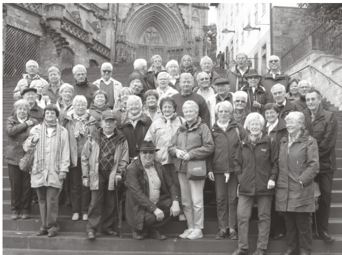
Linner Reisegruppe im Thüringer Wald

Seit nunmehr dreizehn Jahren fährt die Reisegruppe zu deutschsprachigen Städten und Landschaften in Europa.