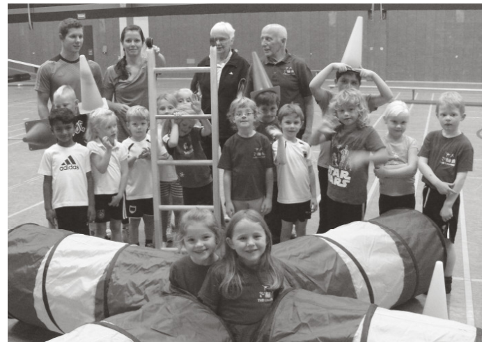
Von dem Erlös wurden diverse Gerätschaften angeschafft