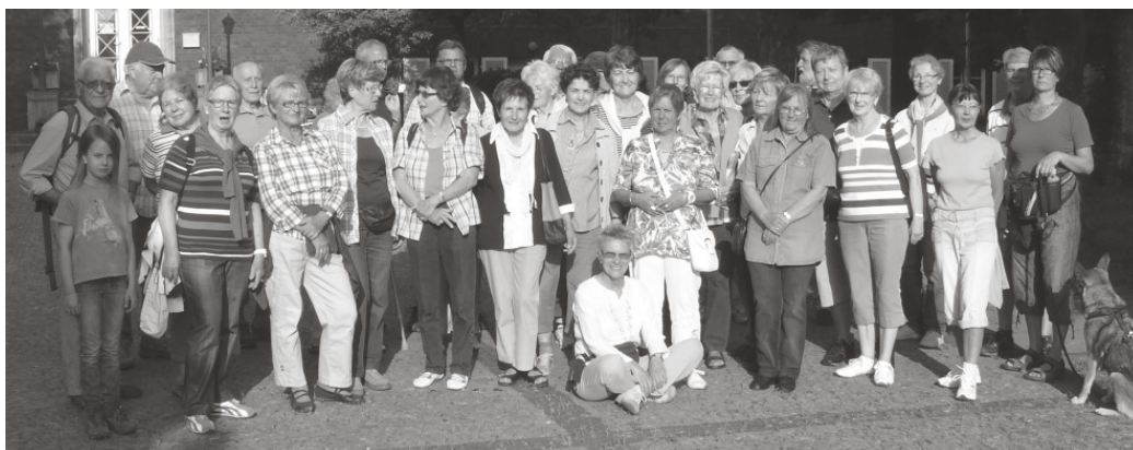
Die Abendwanderer vor dem Sonnenuntergang