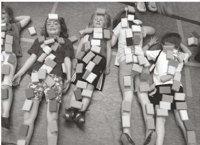
Schwamm auf Kind

Klettern und Werfen erweitert. Die Wahrnehmung, die Kondition und die Koordination werden ganz nebenbei verbessert, denn bei uns steht der Spaß an der Bewegung im Vordergrund. So haben wir den letzten Tag vor den Sommerferien zum Anlass genommen, eine kleine Schatzsuche im Freien zu unternehmen. Mit dem kleinen Schatz in der Hand ging es dann für alle in die wohlverdienten Ferien.