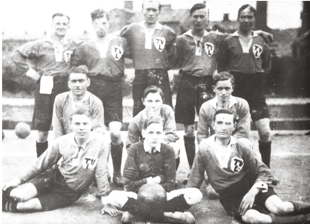
Fußballabteilung TVB Linn um 1919

Trikotfrage war Gegenstand einer längeren und heftigen Debatte.