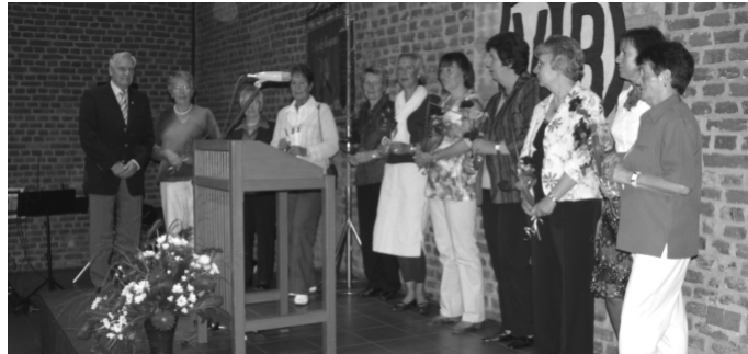
25 Jahre Mitglied im TVB

Musikalisch unterhalten wurde die Veranstaltung vom Linner Shanty-Chor. Wie in den Jahren zuvor wurde die Bewertung durch die 1. Schützenkompanie und den Frauen der Gymnastikabteilung organisiert, ein Dankeschön an diese beiden Gruppen.