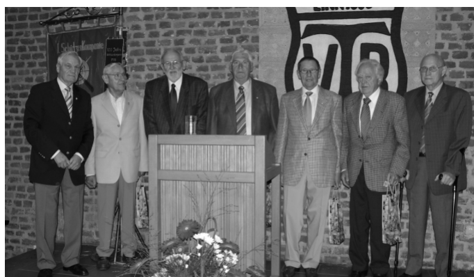
60 und 70 Jahre Mitglied im TVB