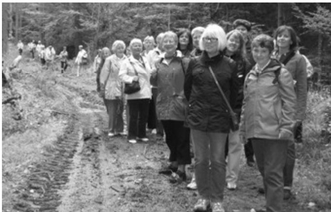
Eine zweistündige Wanderung durch das wunderschöne Bodentbachtal bis zum Restaurant „Im Wintergarten“ in Eicherscheid.