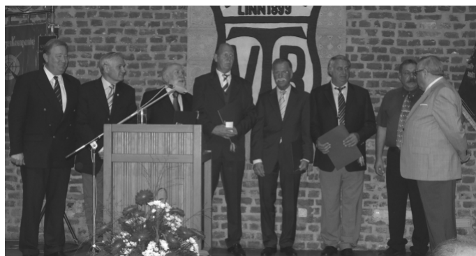
50 Jahre Mitglied im TVB wurden zu Ehrenmitgliedern ernannt