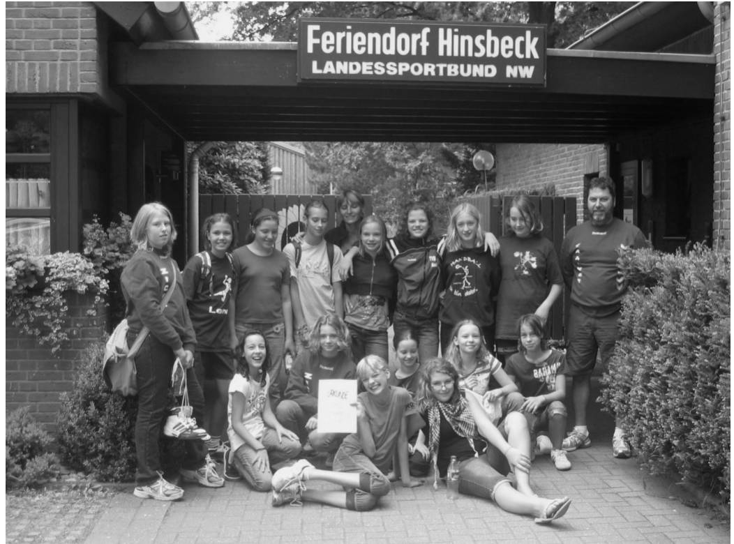
Die weiblich Jugend im Feriendorf Hinsbeck

Der kleine Hunger meldete sich auch schon, also ab zum Essen