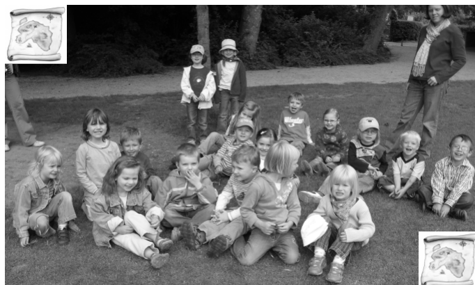
Teilnehmer der Schatzsucher

nämlich den Spielplatz an der Linner Burg. Dort konnten sie endlich nach ihrem langersehnten Schatz suchen und sich austoben, bevor es dann in die Sommerpause ging. Eine Woche später, am 23.06.2008, startete eine Rallye