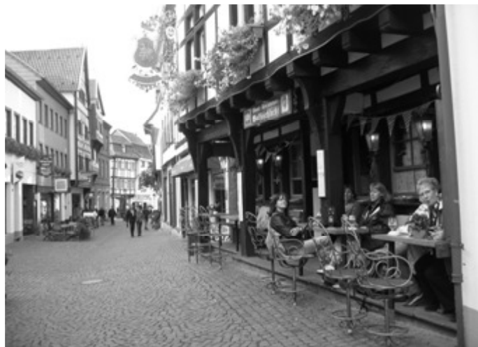
Die TVB-Frauen im mittelalterlichen Städtchen BAD MÜNSTEREIFEL