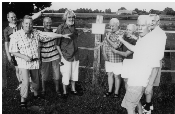
Finger weg!!! Von Fremden Eigentum—streicheln und füttern v verboten. Am Zaun einer Kuhwiese im Raum Willich.

In letzter Zeit häufen sich wieder Diebstähle in der Turnhalle Kohlplatzweg. Wir bitten Sie, Wertsachen immer mit in die Halle zu nehmen.