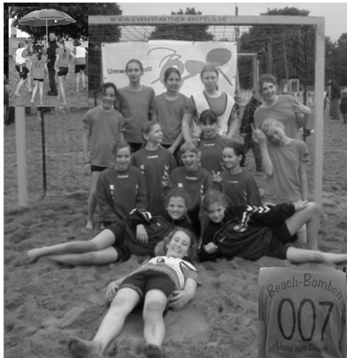
Die „Beachbomben“ im Tor