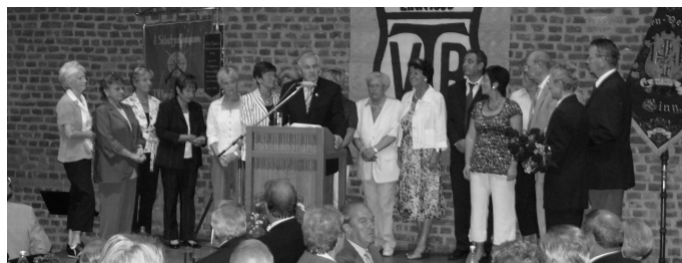
Die goldene Vereinsnadel für 40-jährige Mitgliedschaft wurde überreicht