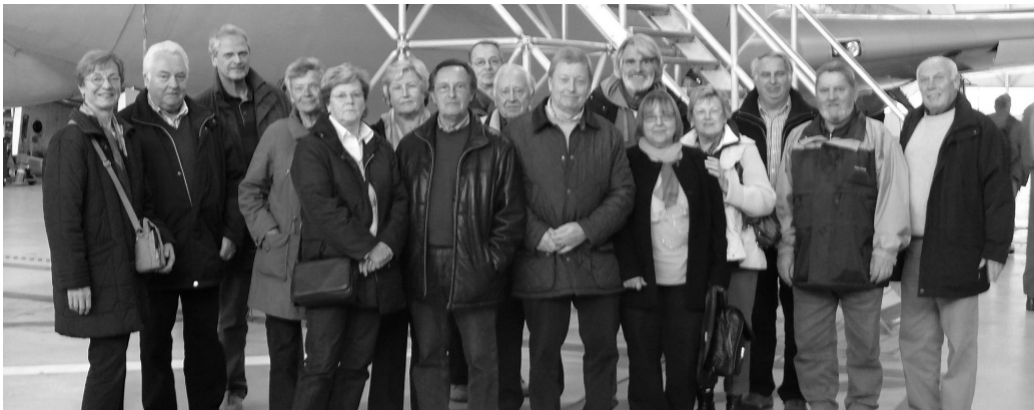
Die Gruppe des TVB beim NATO Besuch

Grillspezialitäten, kühle Getränke, erzählen, auch ein Handballspiel unserer Oldies verfolgen, alles zusammen, es war wieder ein schönes Zusammensein unserer Vereinsfamilie.